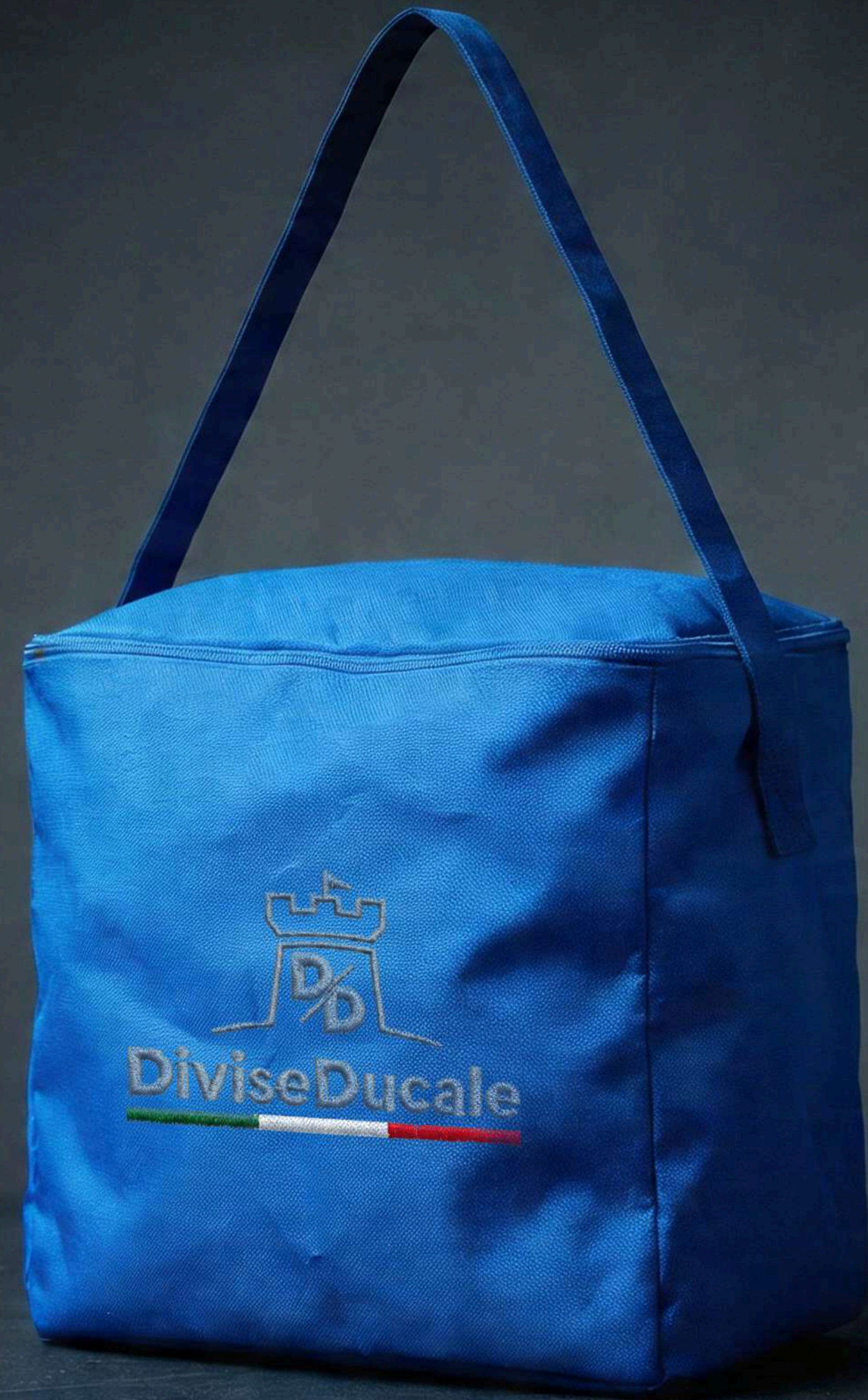
Sacca personalizzata con nome