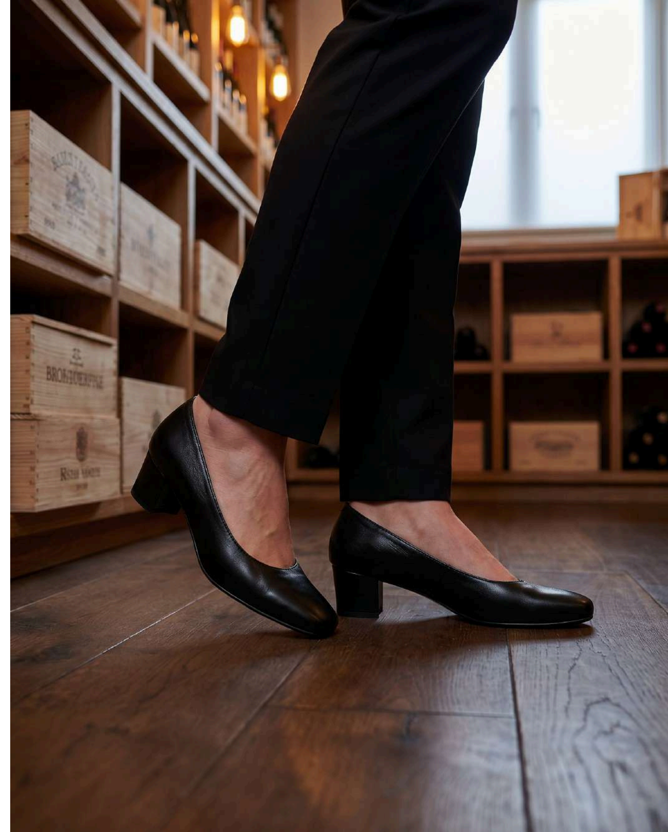
Calzatura da sala/accoglienza nera chiusa in pelle morbida modello ballerina con tacco a norma di legge 4cm